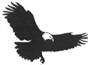
Matriz de las Águilas S.O.A.R.